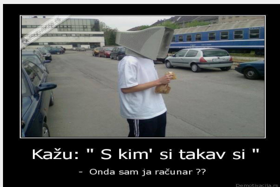
Slika br. 4: www.facebook.com/SundjerBob.page

Simptomatičnijih razmišljanja smo i povodom sledeće dve slike: