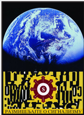
Slika br. 1, „Razmišljajte o signalizmu“, razglednica

signalism“); može biti autocitat (neko promovise svoju umetničku reč ili misao, ma kakva bila), a Miroljub Todorović zapisuje u dnevnik stihove iz kasnijih pesničkih zbirki Zlatno runo 4 i Ljubavnik nepogode 5 , ali i npr. pesmu koja pripada žanru nađene poezije – „Dve pege na kurcu“. 6