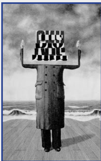
Slika br. 5: http://mtodorovic2.blogspot.com/2007/06/visual-poetry-vp-1990.html