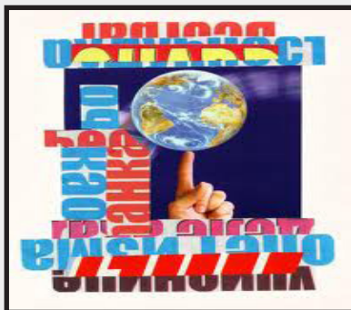
Slika br. 6, „Planetarna komunikacija“, korice na knjizi: Miroljub Todorović, „Vreme neoavangarde“, Altera, Beograd, 2012.